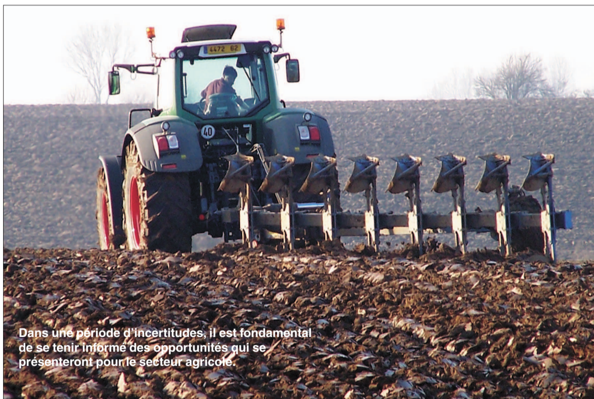
Dans une période d'incertitudes, il est fondamental de se tenir informé des opportunités qui se présenteront pour le secteur agricole.

Jeudi 9 février, les adhérents de l'Union des syndicats agricoles de l'Aisne ont rendez-vous à Laon pour leur assemblée générale annuelle. L'objectif de cette rencontre consiste à échanger sur les dossiers conjoncturels et structurels avec les dirigeants départementaux et nationaux. p.5