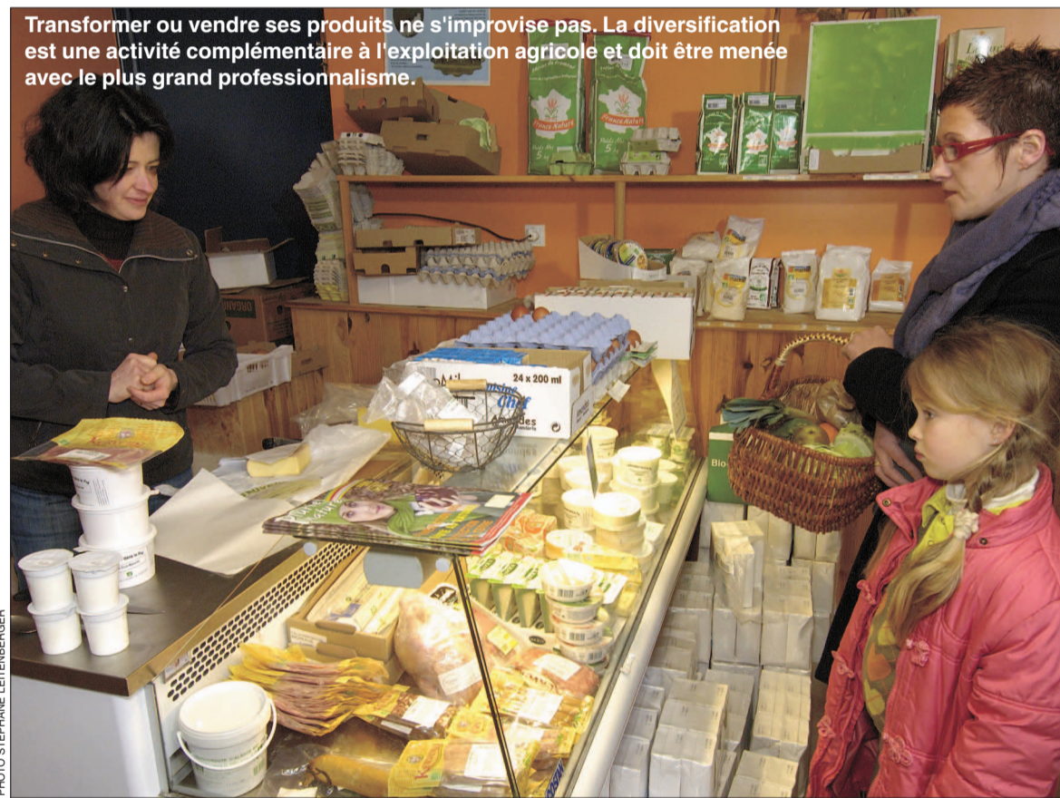
Transformer ou vendre ses produits ne s'improvise pas. La diversification est une activité complémentaire à l'exploitation agricole et doit être menée avec le plus grand professionnalisme.

En agriculture, la diversification désigne la mise en place au sein d'une exploitation d'une production ou activité nouvelle en complément des productions classiques de la région. Des exemples de diversification multiples et variés ont vu le jour. Pour cela, la Chambre d'agriculture propose un accompagnement adapté à chaque étape du projet.