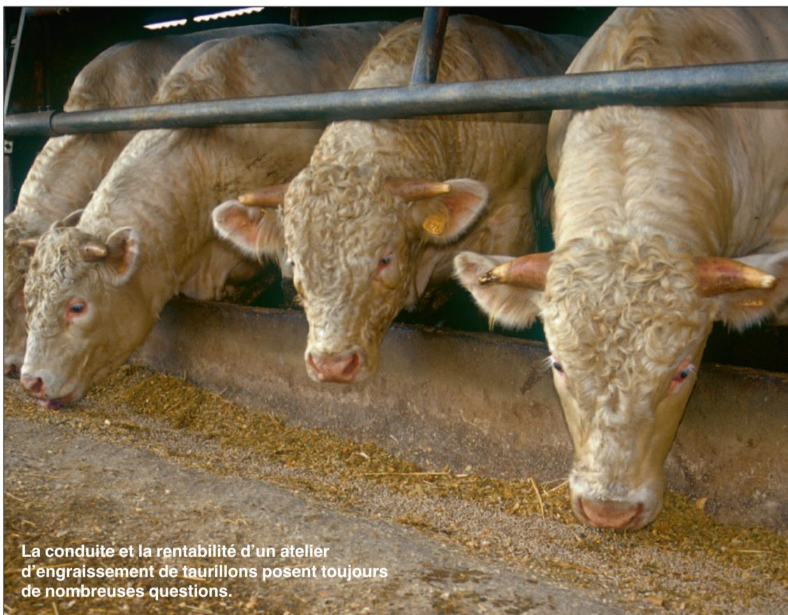
La conduite et la rentabilité d'un atelier d'engraissement de taurillons posent toujours de nombreuses questions.

Afin d'accompagner les producteurs de jeunes bovins, la Chambre d'Agriculture de l'Aisne a organisé un cycle de formation sur l'engraissement.