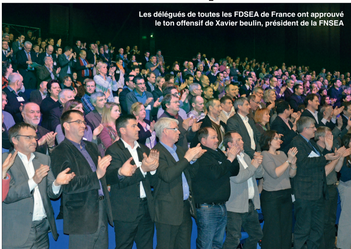
Les délégués de toutes les FDSEA de France ont approuvé le ton offensif de Xavier beulin, président de la FNSEA

Du 26 au 28 mars, à Troyes dans l'Aube, le syndicalisme majoritaire, conforté par le résultats des élections Chambres d'agriculture, a résolument adopté un ton combatif et offensif. p.I